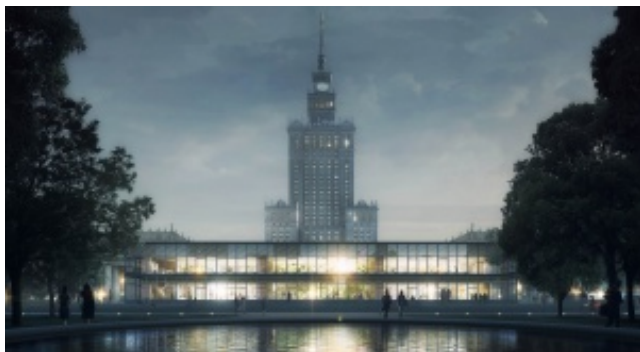
To już pewne. Pawilon Emilia przeniesiony przed Pałac Kultury i Nauki