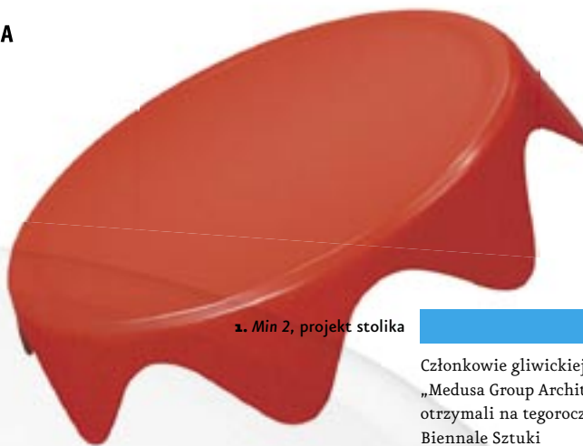
1. Min 2, projekt stolika

Konkurs SARP, projekt Europejskiej Akademii Muzyki w Chodzieży, 2002, wyróżnienie