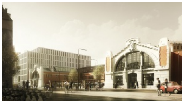
Targ wraca do Hali Koszyki