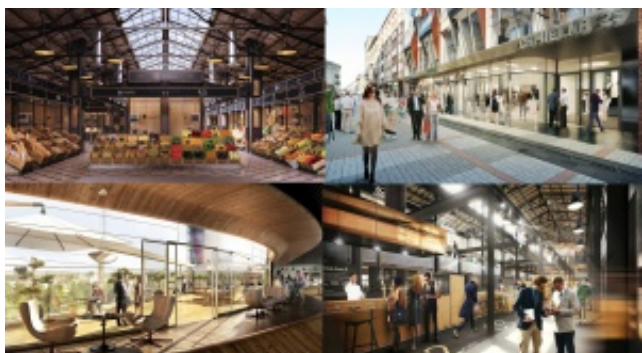
Handel w nowym stylu