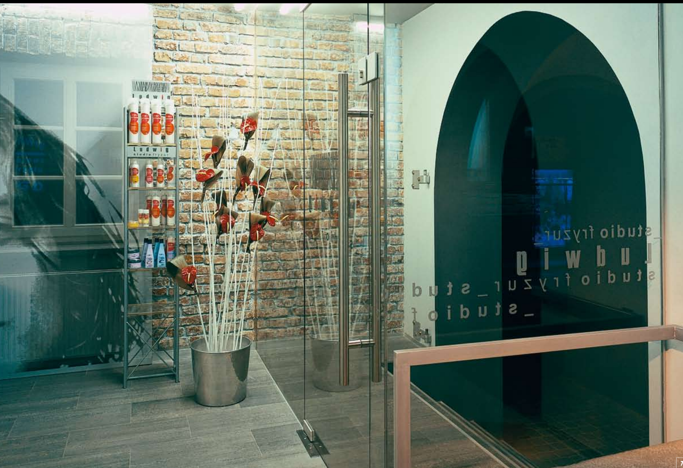
7, 8. Fragment of the entrance zone