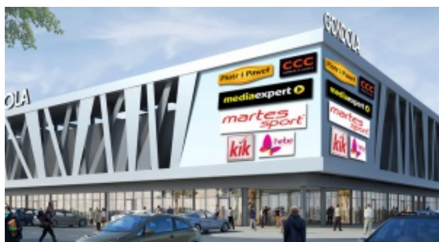
Coraz bliżej otwarcia kolejnej galerii spod kreski BOSE