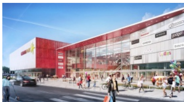
Gemini Park Tychy będzie miał charakter miejskiej ulicy