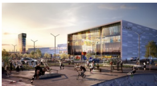
Na starcie Galeria Libero w Katowicach. To projekt MOFO Architekci