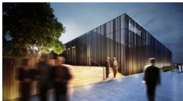
Była stołówka wojskowa zmieni się w biurowiec. To projekt Medusa Group