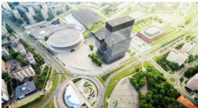
Katowicki biurowiec projektu Medusa Group z wykonawcą