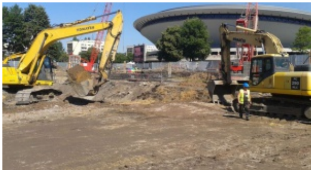
Najnowsze wieści z budowy biurowca .KTW